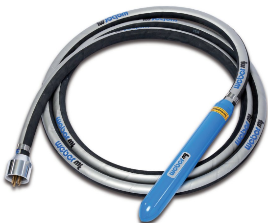
Вибратор IVU 58