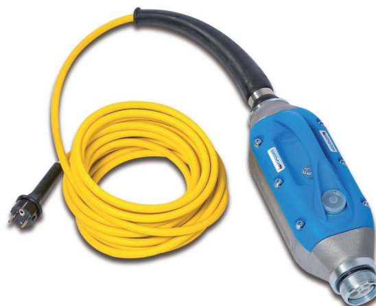
Преобразователь UR 1.6